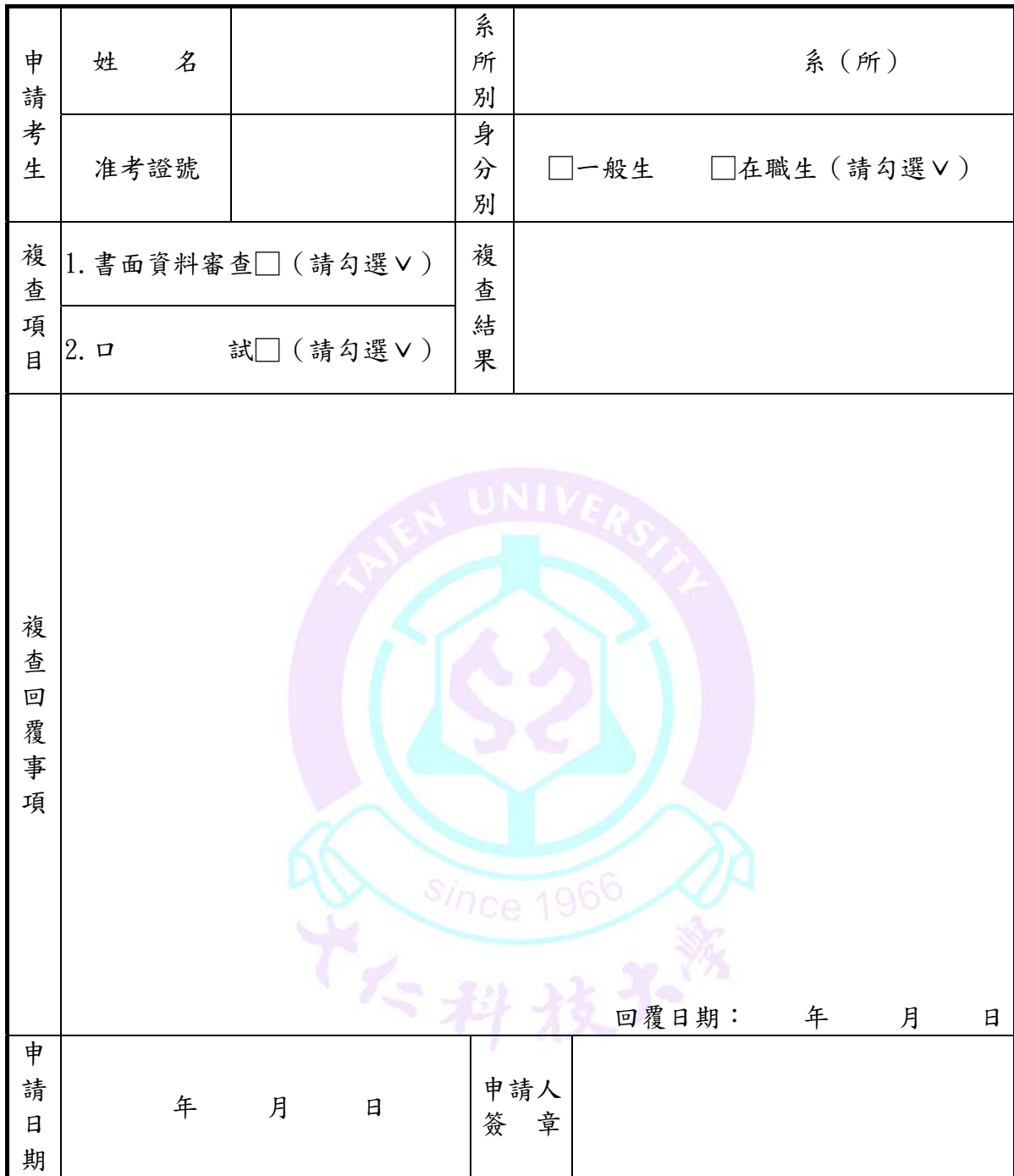
附表（九）大仁科技大學 108 學年度研究所碩士班甄試入學招生成績複查申請表