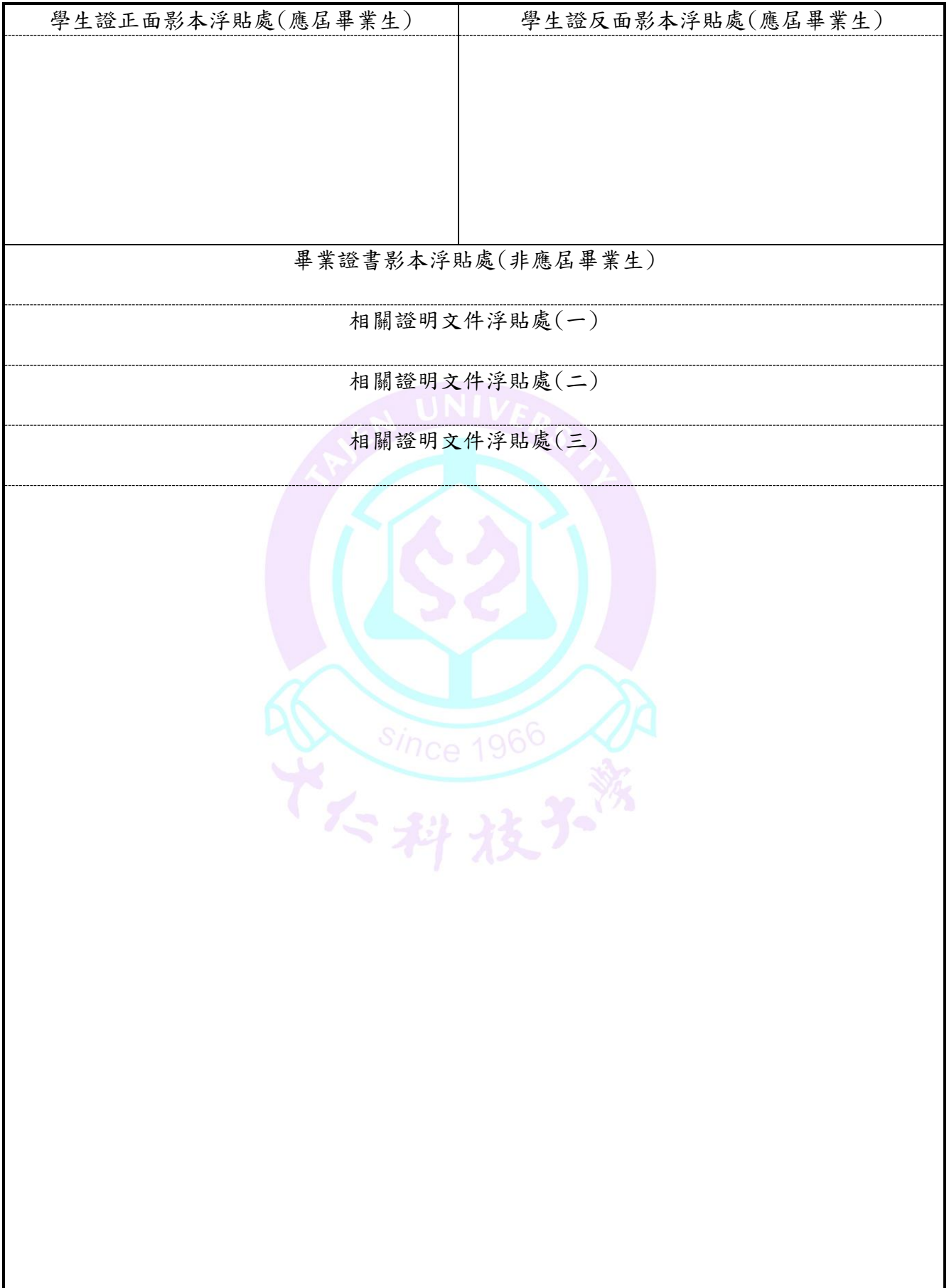
附表（五）研究所碩士班甄試入學報名考生學歷(力)證件及相關證明文件浮貼表