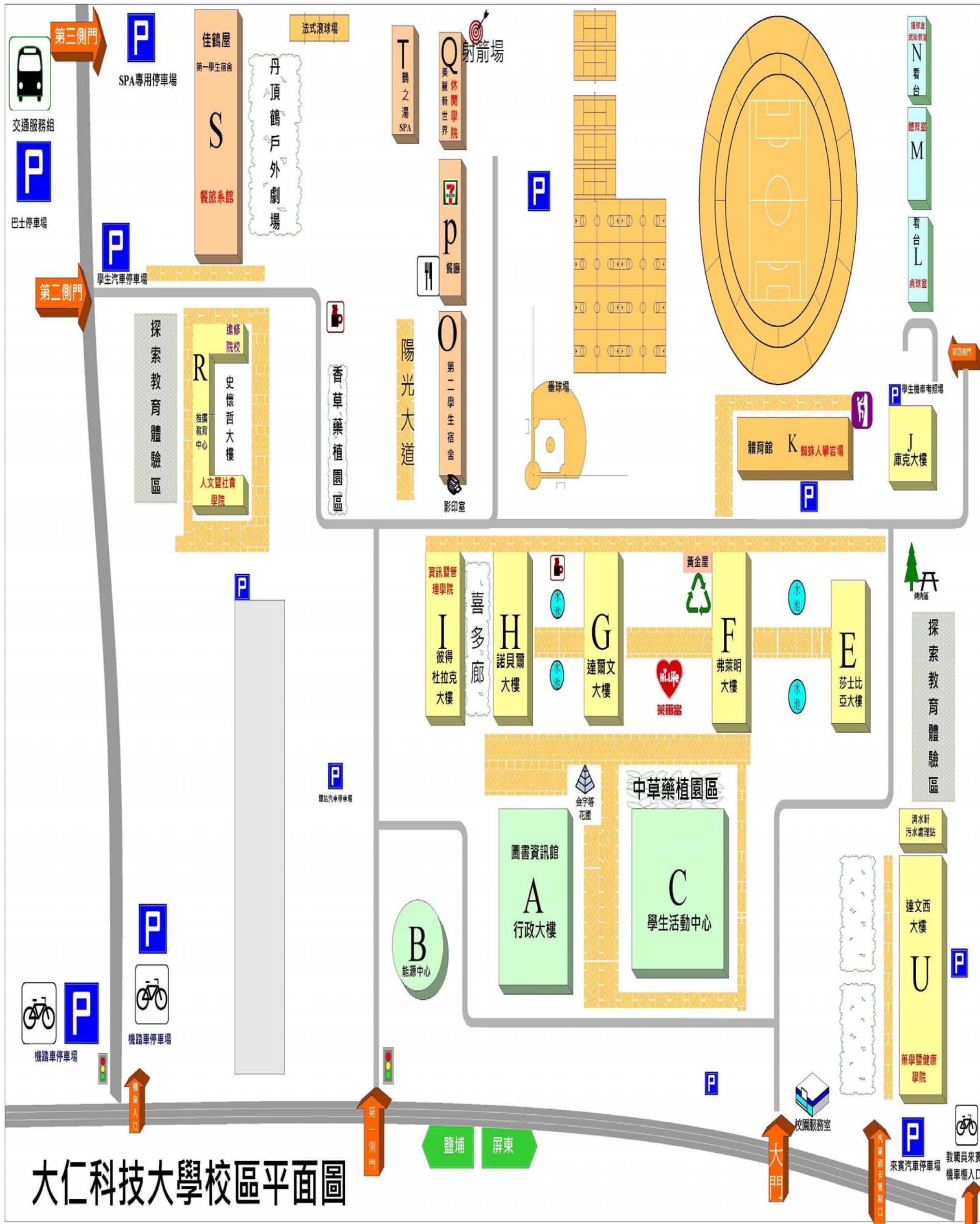
大仁科技大學校區平面圖