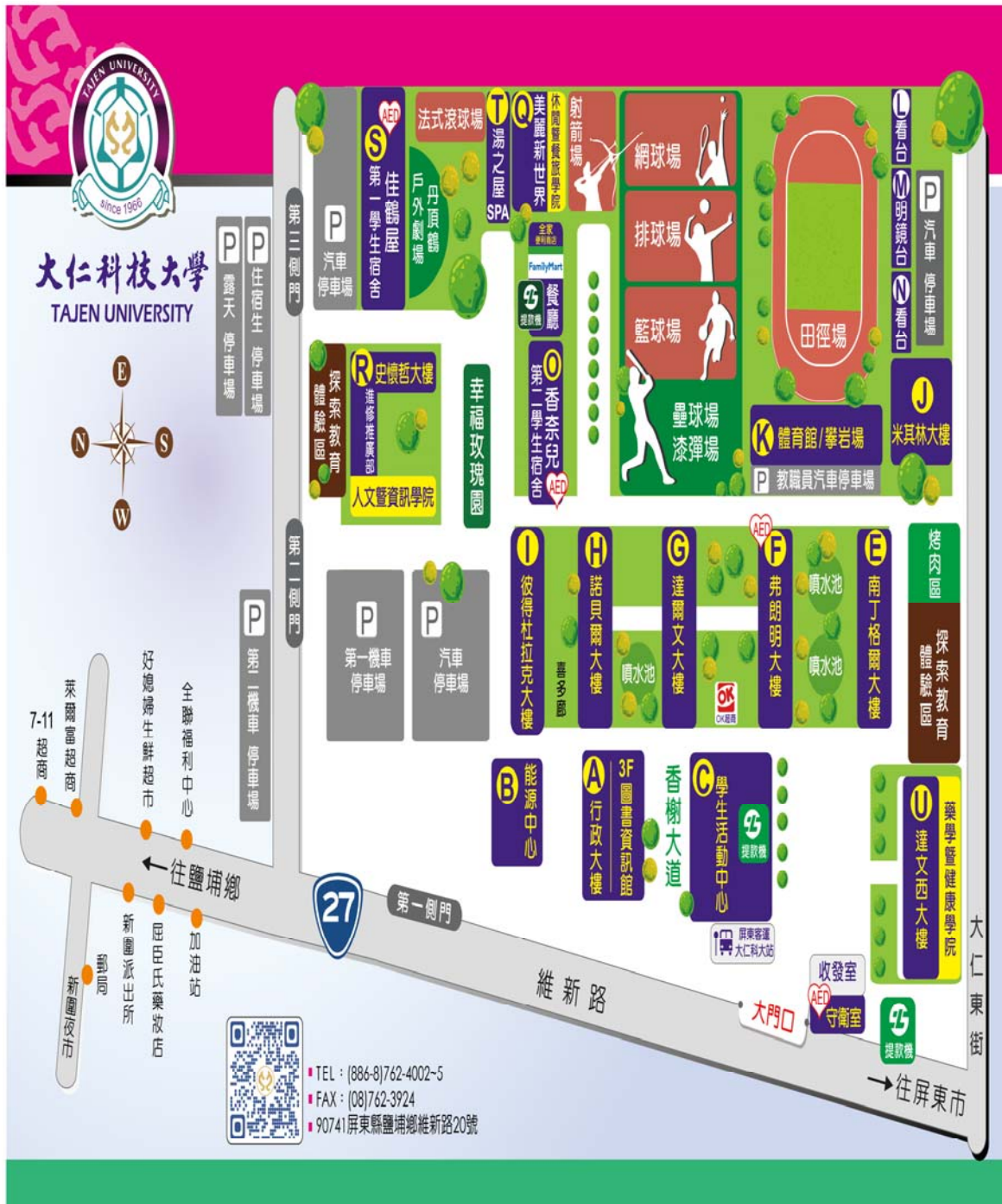
【附件十一】大仁科技大學校區平面圖