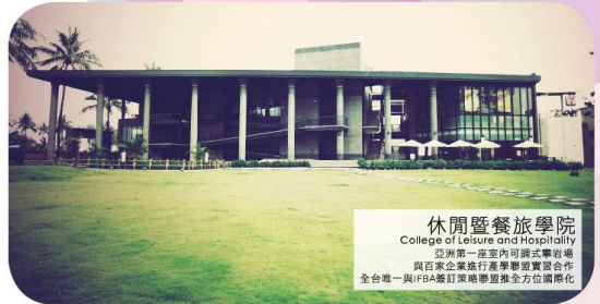
休閒暨餐旅學院 College of Leisure and Hospitality 亞洲第一座室內可攜式攀岩場 與百家企業進行產學學研實習合作 全台灣唯一與IFBA簽訂業聯盟暨全方位國際化