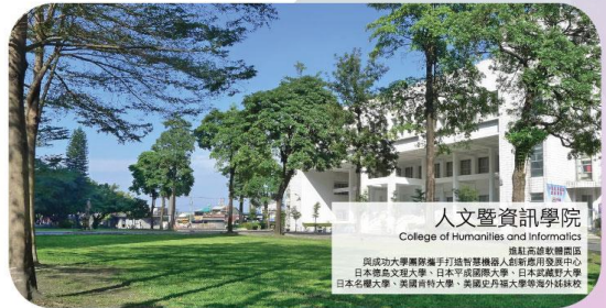
人文暨資訊學院 College of Humanities and Informatics 高師高師教育學院 高醫藥中研藥產學聯盟 與成功大學醫藥攜手打造智慧機器人未來發展中心 日本德島文理大學、日本平成國際大學、日本武藏野大學 日本名城大學、美國肯特大學、美國史丹福大學等海外姊妹校