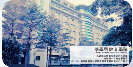
藥學暨健康學院 College of Pharmacy and Health Care 高雄榮民總醫院醫藥訂業培訓場 高醫藥中研藥產學聯盟 全台灣唯一擁護與藥學共同建置臨床實務技能中心之科大