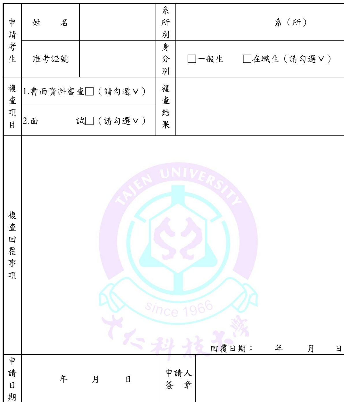
附表（九）大仁科技大學 110 學年度研究所碩士班甄試入學招生成績複查申請表