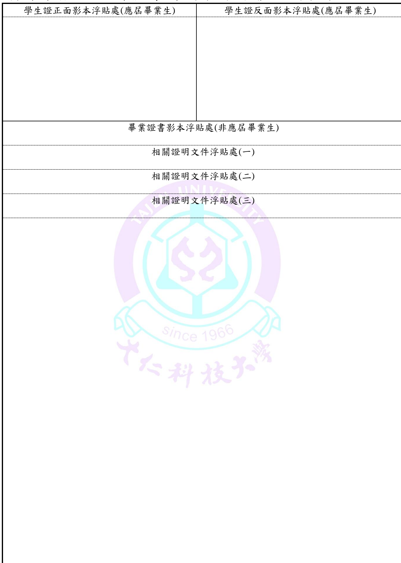
附表（五）碩士班甄試入學報名考生學歷(力)證件及相關證明文件浮貼表