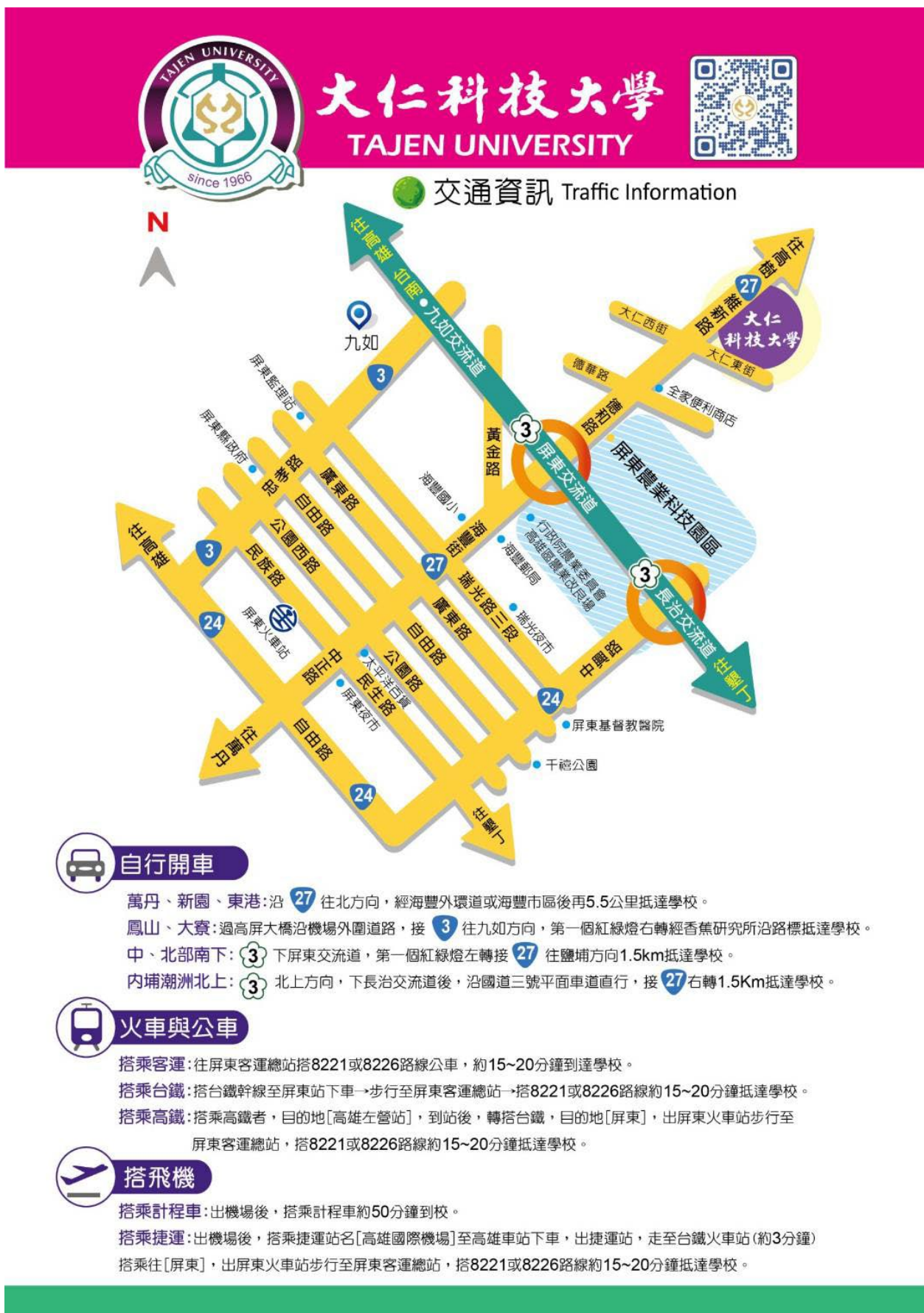
附表九 大仁科技大學交通路線圖