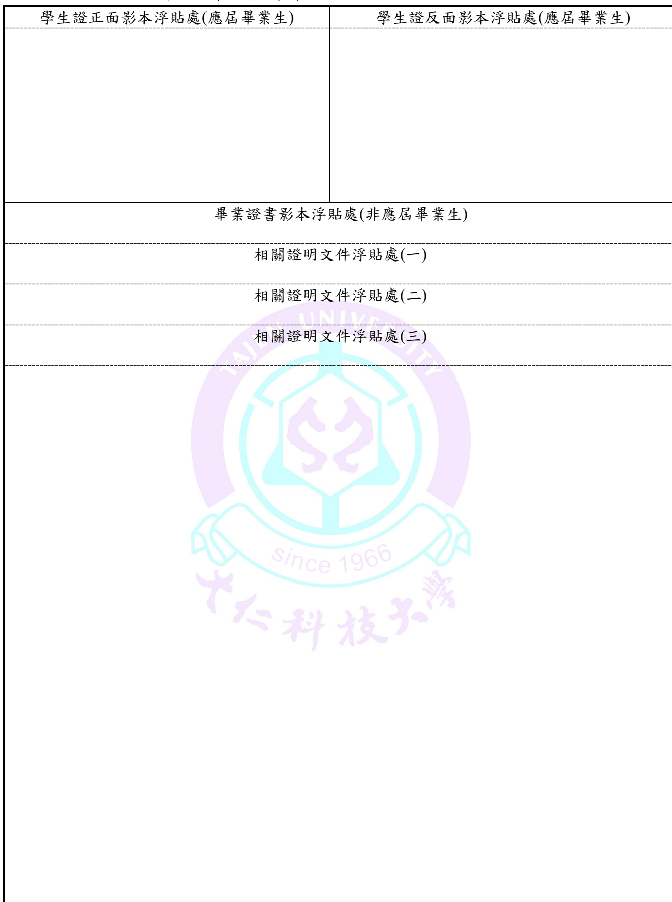
附表三 碩士班甄試入學報名考生學歷(力)證件及相關證明文件浮貼表