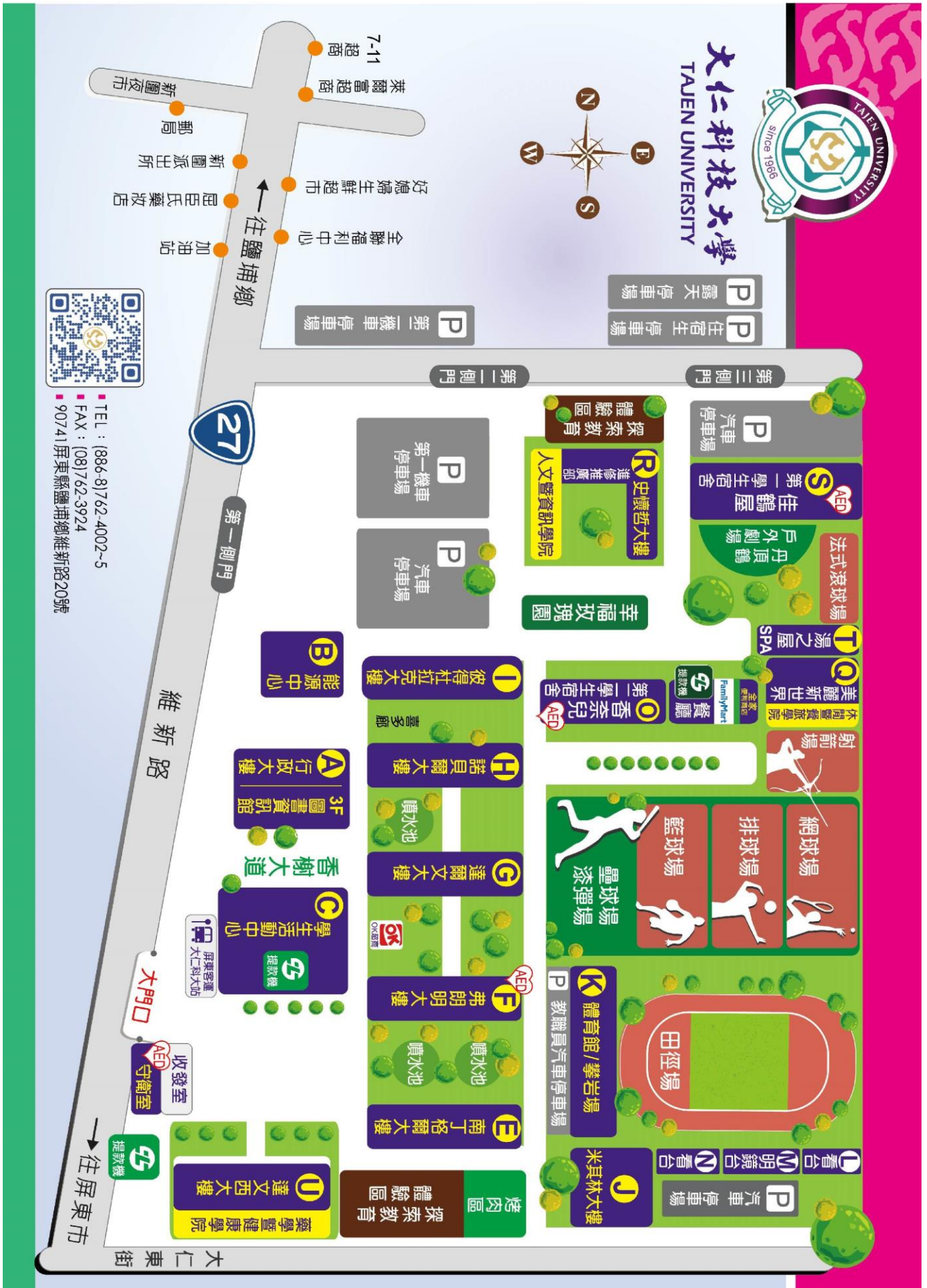
【附件九】大仁科技大學校區平面圖