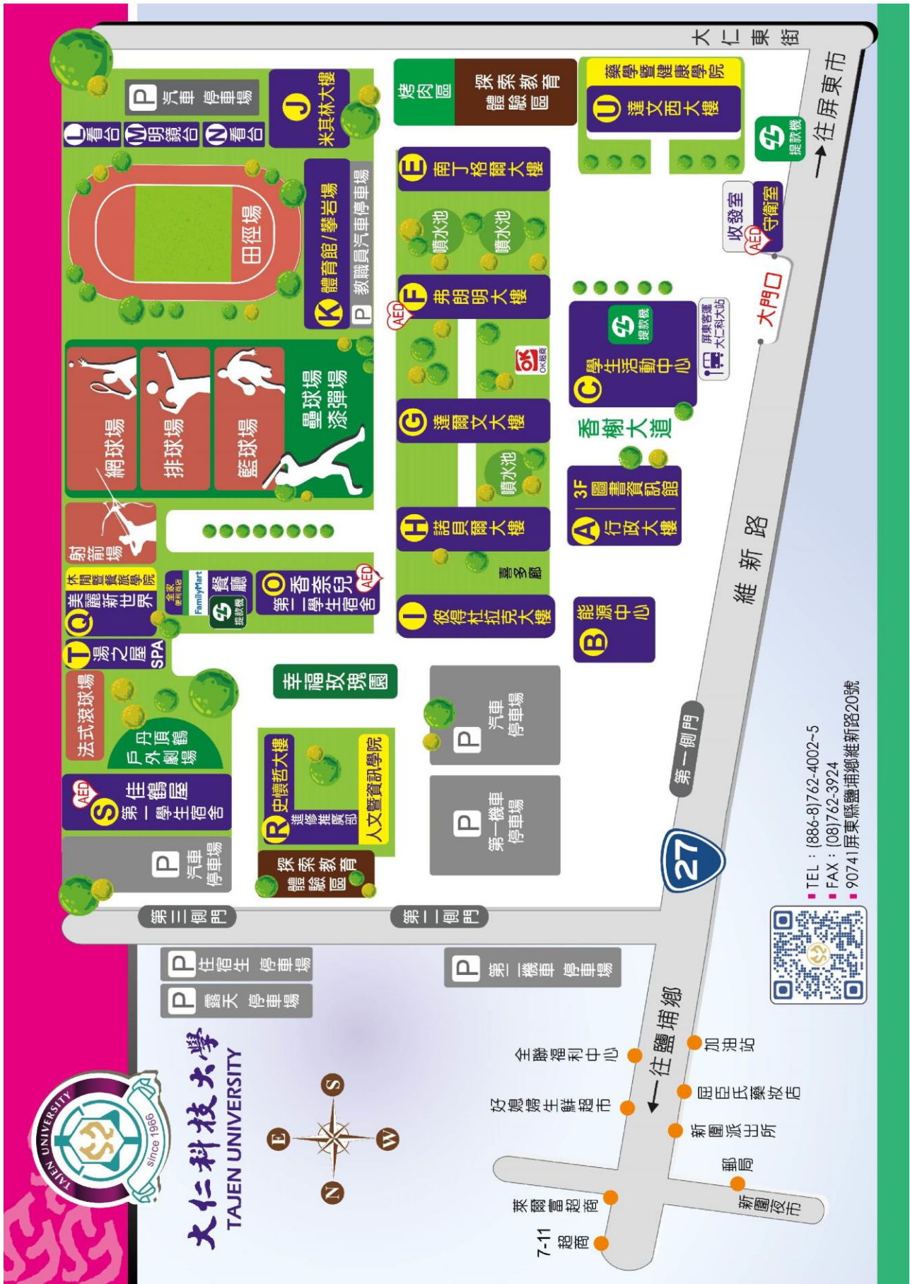
【附件十一】大仁科技大學校區平面圖

TEL : (886-8)762-4002~5 FAX : (08)762-3924 90741屏東縣鹽埔鄉維新路20號