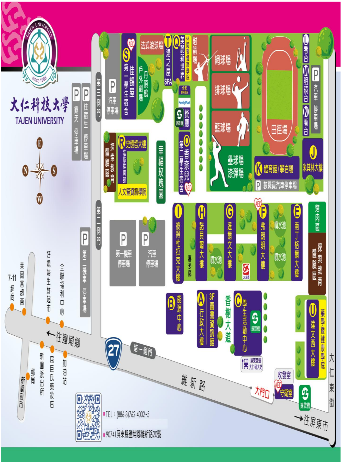
【附件九】本校校區平面圖